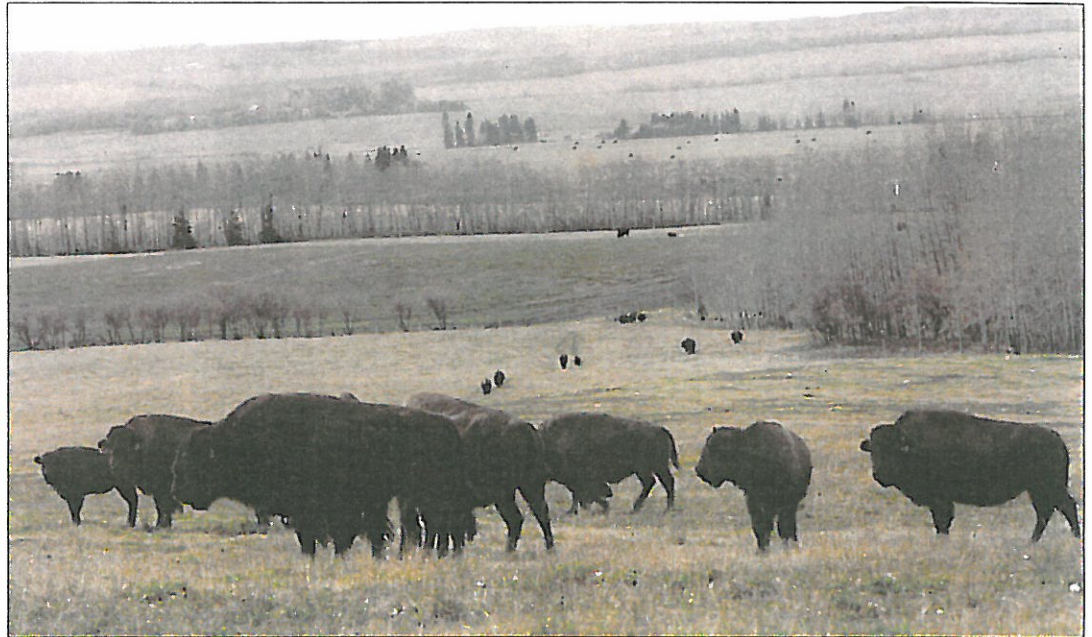
Riesig sind die kanadischen Weiden. Von Massentierhaltung keine Rede.

Carnoglob als Expansionsbecken für Handelsschwankungen zu definieren, wäre akkurat, weil Importüber-