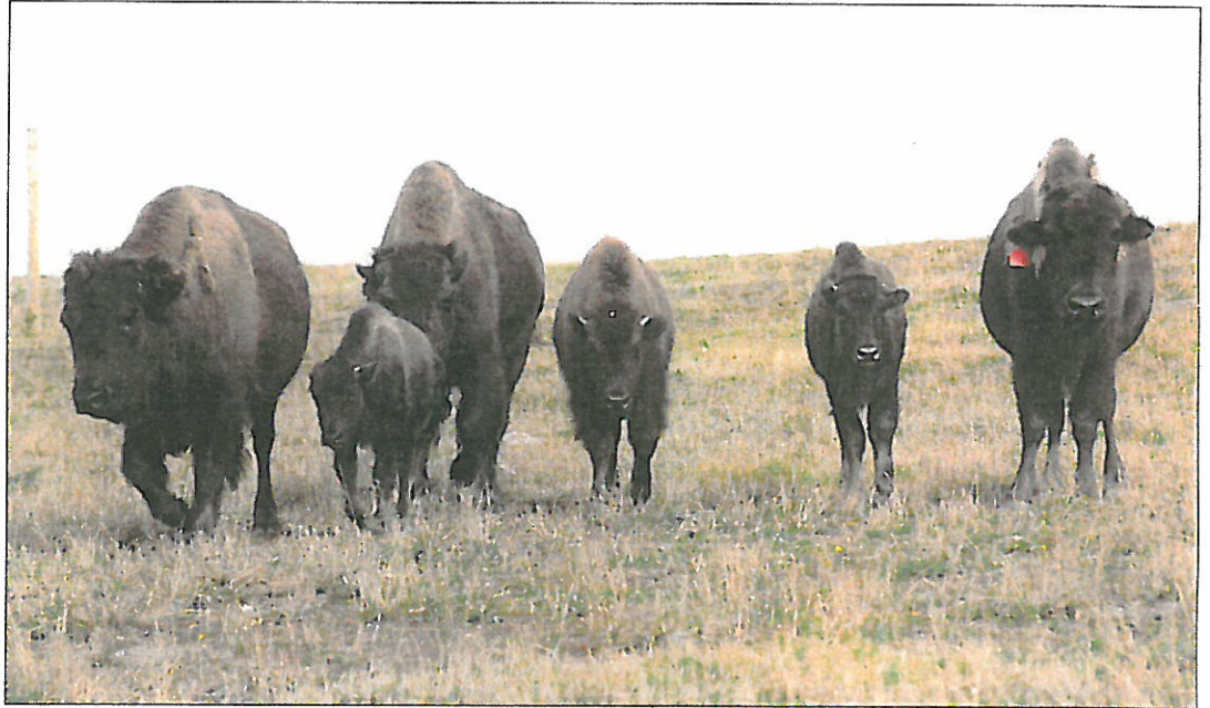
Mehr «Bio» ist nicht möglich, ein valables Verkaufsargument für Bisonfleisch.